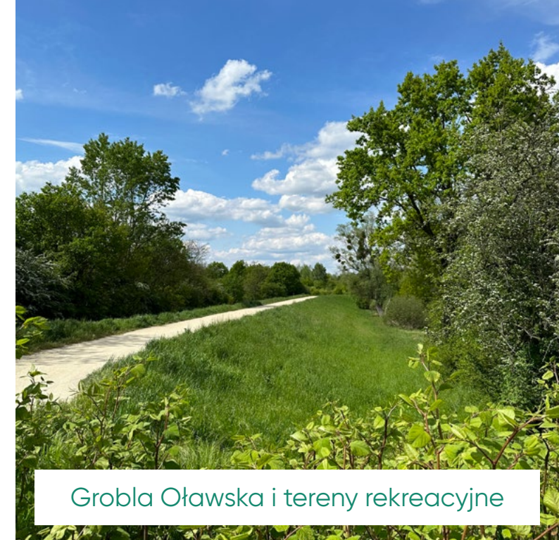
Grobla Oławska i tereny rekreacyjne