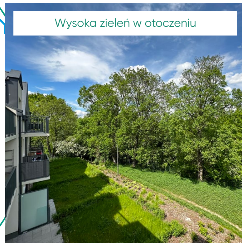
Wysoka zieleń w otoczeniu