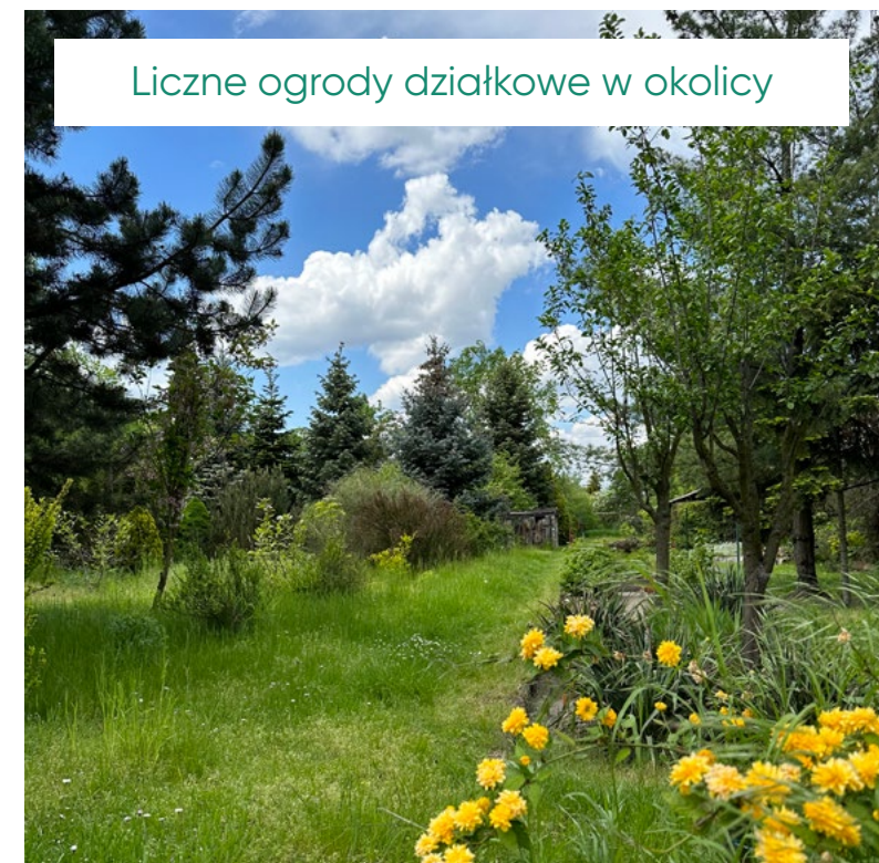
Liczne ogrody działkowe w okolicy