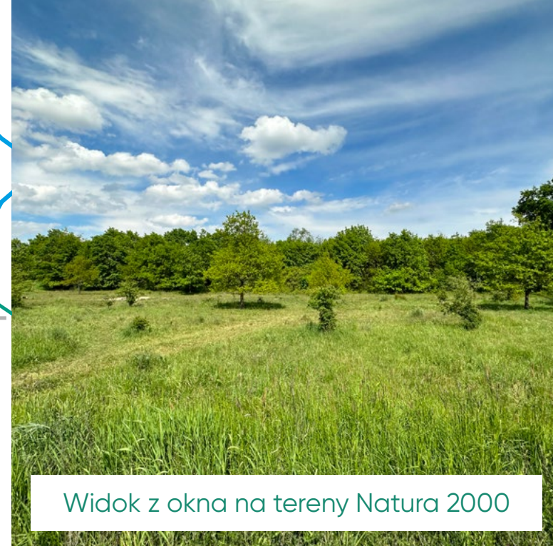
Widok z okna na tereny Natura 2000